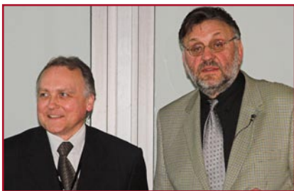
Autor J. Saiger (r.) mit J. Nowacki, VTAD