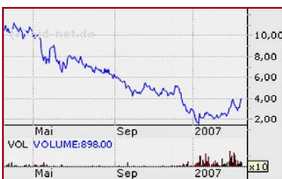
Daystar Inc Kursentwicklung