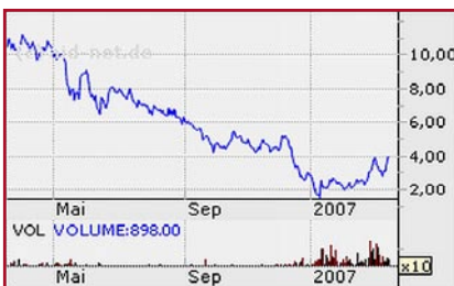
Daystar Inc Kursentwicklung