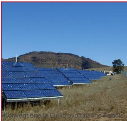
Konventionelle Elektrovoltische Panels

davon ausgehen, dass er Silizium-Technologien langfristig blind vertrauen kann. Neue Verfahren, die Licht in Energie umsetzen sind bereits dem Laborbetrieb entwachsen und stehen kurz davor in Großserienproduktion zu gehen.