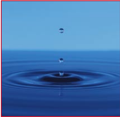
Wasser, Ausgangsbasis für Wasserstoff

Im so genannten Sonnenofen des DLR in Köln-Porz (einer Versuchsanlage, in der die Konzentration des Sonnenlichts zu Forschungszwecken eingesetzt wird) ist es den Wissenschaftlern aus dem DLR-Institut für Technische Thermodynamik erstmals gelungen, Wasser in einem geschlossenen thermochemischen Kreisprozess mittels Solarenergie in Wasserstoff und Sauerstoff zu spalten.