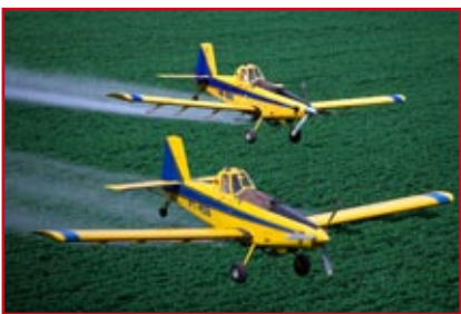
Energie intensive Landwirtschaft