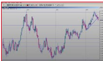
EUR/USD 1,3305 (weekly vom 14.06.07 mit Fibonacci-Unterstützung bei 1,3100)

Viele Anleger sind enttäuscht über den Verlauf ihrer Rentenfonds und über die Kursentwicklung ihrer „Bundesschätzchen“ im Allgemeinen.