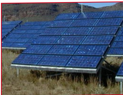
Photovoltaik in Südspanien

rig. Auch die neuen EU-Ländern Bulgarien und Rumänien fördern inzwischen die erneuerbaren Energien.