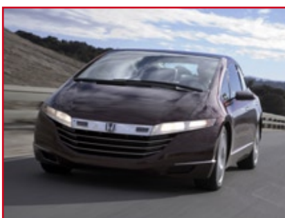
FCX Honda Wasserstoffantrieb