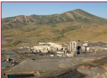
Jerritt Canyon Nevada Golderzverarbeitung