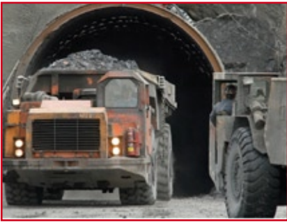
Jerrit Canyon Nevada Minenportal

hätte in der Führungsstruktur das Know-how um auch große Förderungen zu optimieren und ertragsstark zu machen.