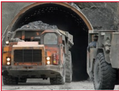
Jerrit Canyon Nevada Minenportal

hätte in der Führungsstruktur das Know-how um auch große Förderungen zu optimieren und ertragsstark zu machen.