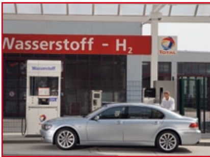
BMW 7er Wasserstoff/Benzin Antrieb

Kraftstoff mit einer Reichweite von ca. 500 km fahren und durch einfaches Umschalten auf Wasserstoffzufuhr weitere 200 km fahren. Das verhindere, sagte uns Herr Kammerer, Probleme mit dem Tanken von Wasserstoff, der natürlich noch nicht die breite Verfügbarkeit wie Benzin habe. Da brauche es noch Aufbauarbeit im Markt.