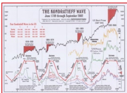
Kondratieff Wellen USA