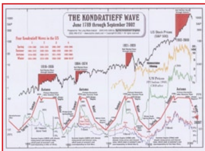
Kondratieff Wellen USA